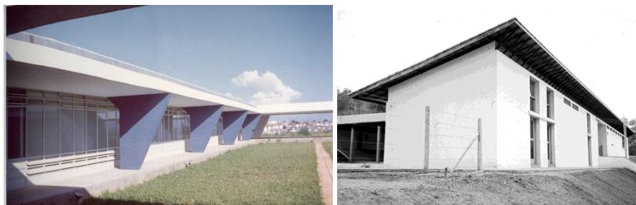
Fig. 5. – Ginásio de Guarulhos. 1959. João Vilanova Artigas e Carlos Cascaldi.