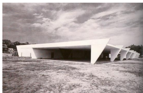
Fig. 3 – Fórum de Itapira.1959. Joaquim Guedes.