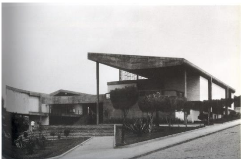
Fig. 2 – Fórum de Avaré. 1962. Paulo Mendes da Rocha e João de Gennaro.